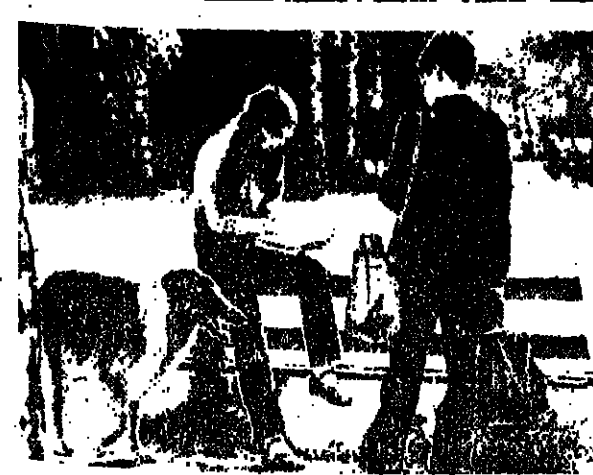
في ازالة موسكو

وعلى الرغم من كل تاريخ التسجيلات الصوتية . منذ اشكالها البدائية السمية التي حفظت ليوغيبلا سوللتسلا